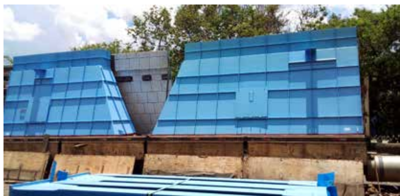
Fornecimento para Serra Verde.

O escopo conta com o detalhamento dos projetos executivos, fornecimento de toda a matéria prima, aplicação de revestimentos antidesgaste metálicos e não metálicos, tratamento superficial anticorrosivo de jateamento abrasivo e pintura, inspeções, testes e transporte até o local do empreendimento. A previsão de término do fornecimento é junho/2022.