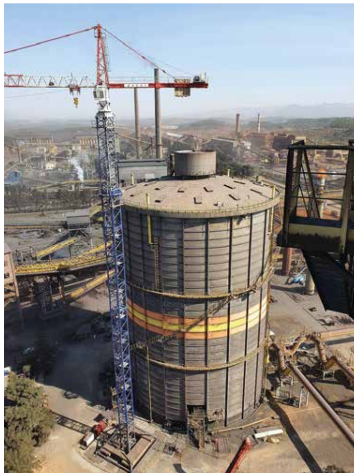
Vista aérea do Gasômetro GCO, em Ouro Branco-MG.